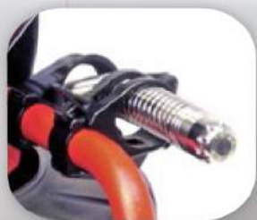
25 мм самонивелираща се камера – за по-лесно навигиране в тръби с малък диаметър