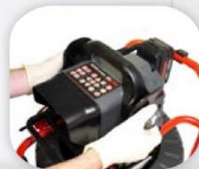
Ръкохватка за транспортиране – за да носите цялата инспекционна система с едната си ръка