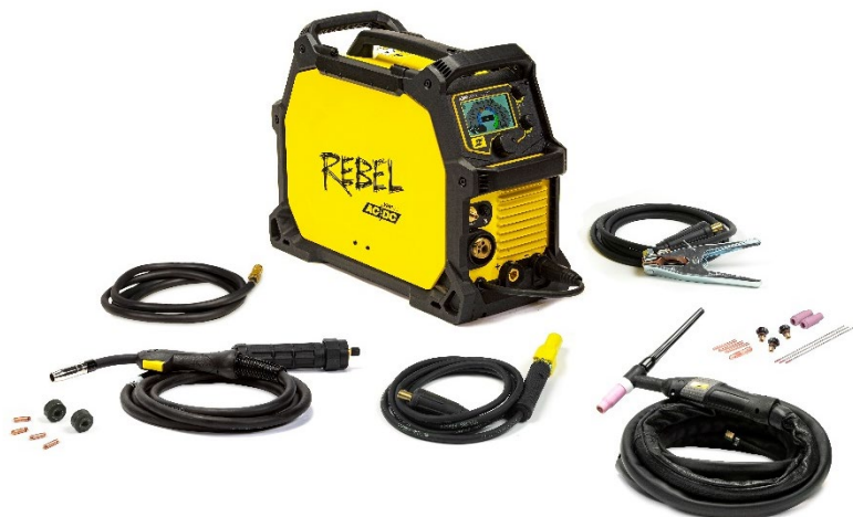
Rebel EMP 205ic AC/DC и аксесоари