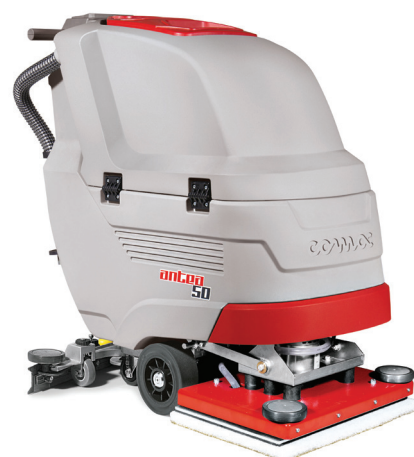
Antea 50 BTO Orbital