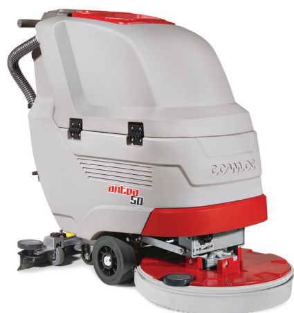
Antea 50 E-B-BT