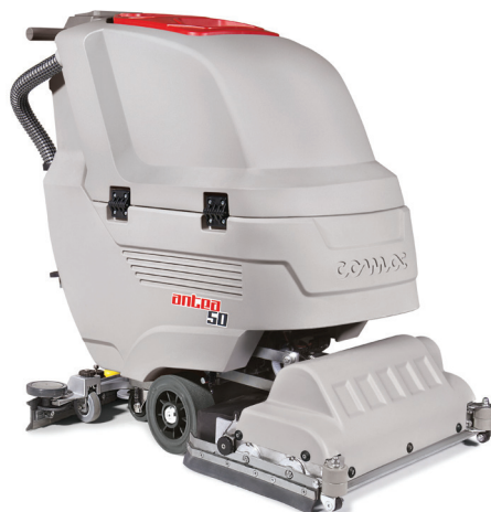
Antea 50 BTS