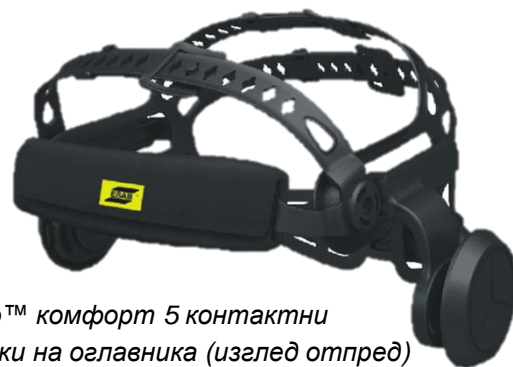
Halo™ комфорт 5 контактни точки на оглавника (изглед отпред)

За повече информация посетете esab.com .