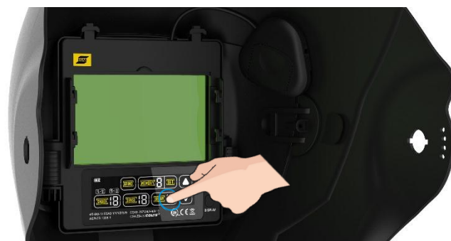
Висок оптичен клас на фотосоларната касета, с цветен сензорен интерфейс