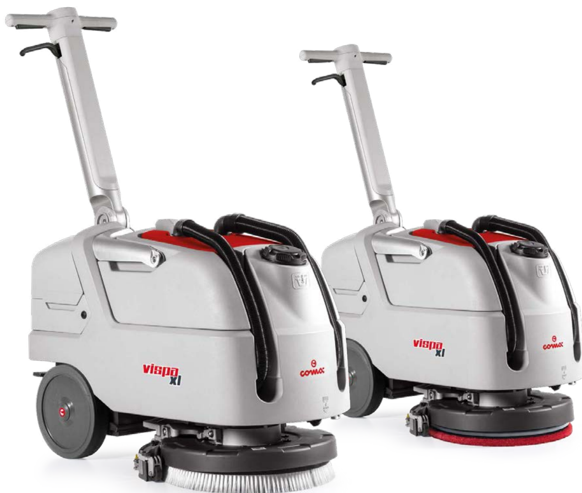
VISPA XL Версия с дискова четка Работна ширина: 430 mm