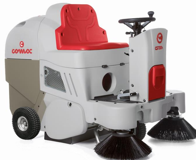
CS 700 H

С ел. задвижване на предното колело На батерии 70 cm централна четка Панелен филтър Електрическо изтупване на филтъра Ръчно изпразване Електрически мотори