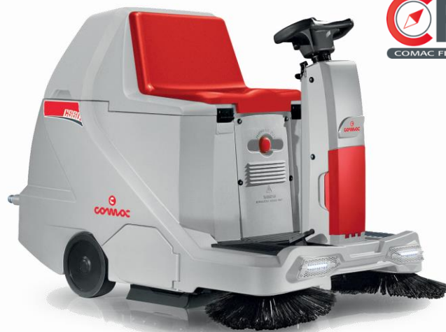
CS 60 B 2016

С ел. задвижване на задните колела На батерии 60 cm централна четка Панелен филтър Електрическо изтупване на филтъра Ръчно изпразване