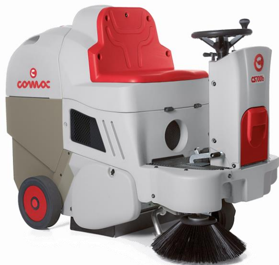
CS 700 B

С ел. задвижване на предното колело На батерии 70 cm централна четка Панелен филтър Електрическо изтупване на филтъра Ръчно изпразване Електрически мотори