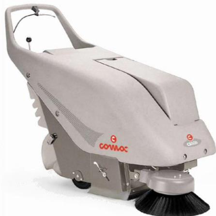
CS 50 BT

На батерии Без traction Панелен филтър Ръчно изструпване на филтъра