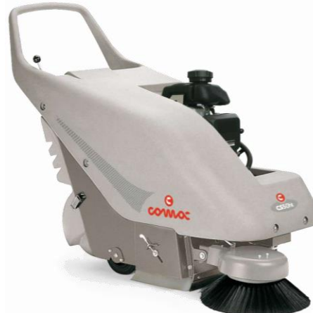
CS 50 H

На батерии C traction Панелен филтър Ръчно изструпване на филтъра