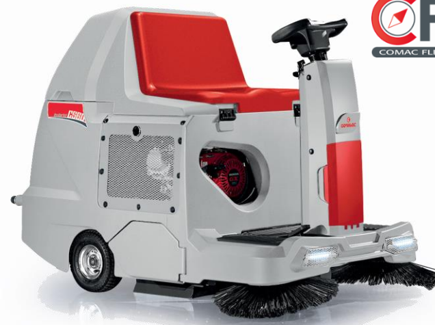
CS 60 Hybrid 2016

С ел. задвижване на задните колела На батерии 60 cm централна четка Панелен филтър Електрическо изтупване на филтъра Ръчно изпразване