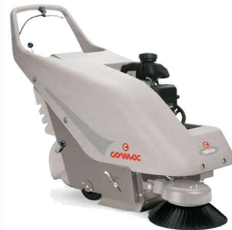
CS 50 HT

На бензин Без traction Панелен филтър Ръчно изструпване на филтъра