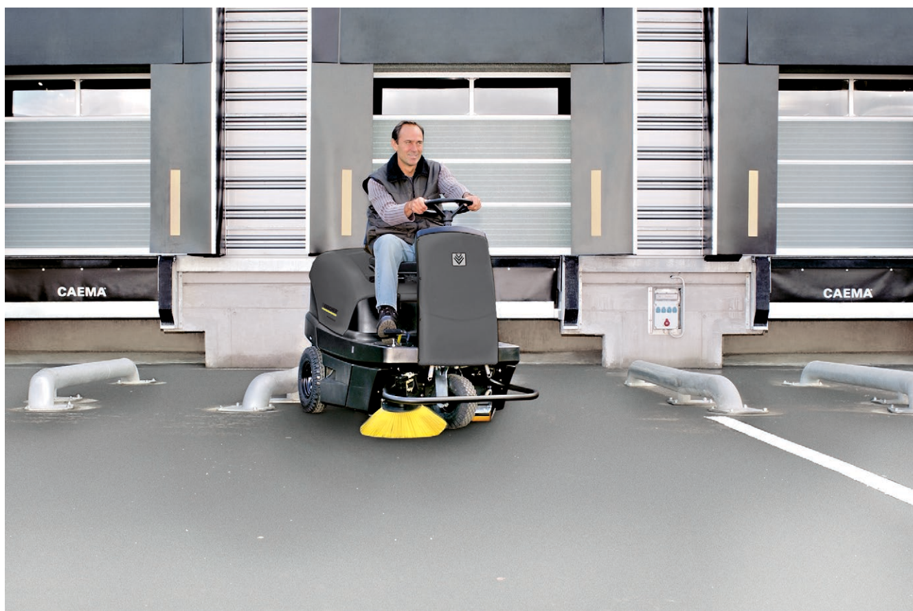
KM 100/100 R D